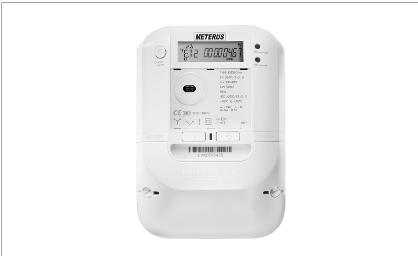
Abbildung 1: Smart Meter.

Mit dem vom Bundeskabinett im November 2015 beschlossenen Gesetzesentwurf zur Digitalisierung der Energiewende hat die Debatte um Sinn oder Unsinn eines flächendeckenden Rollouts von Smart Metern (digitalen Stromzählern, siehe Abbildung 1) erneut an Intensität gewonnen. Das Gesetz soll im ersten Quartal des Jahres 2016 vom Bundestag beschlossen und im Bundesrat beraten werden. Der Zeitplan könnte aber noch modifiziert werden, da sich starke Widerstände abzeichnen.