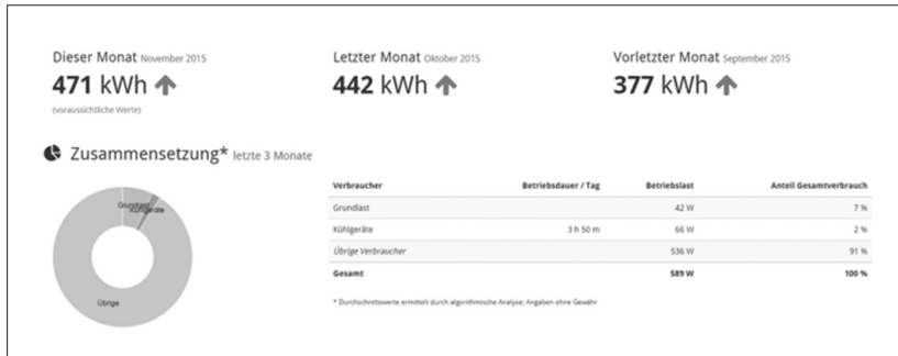
Abbildung 4: Statistische Auswertung über Smart Meter-Messstellenbetreiber discovery, Privathaushalt. Eigene Darstellung (CC BY-SA 3.0).

Darüber hinaus entfallen für einige Verbraucher das Selbstablesen und die oft als lästig empfundene telefonische Durchgabe des Jahresverbrauchs per Sprachcomputer. Die Enttäuschung über diese Vorteile dürfte bei vielen Verbrauchern angesichts der Kosten aber groß sein.