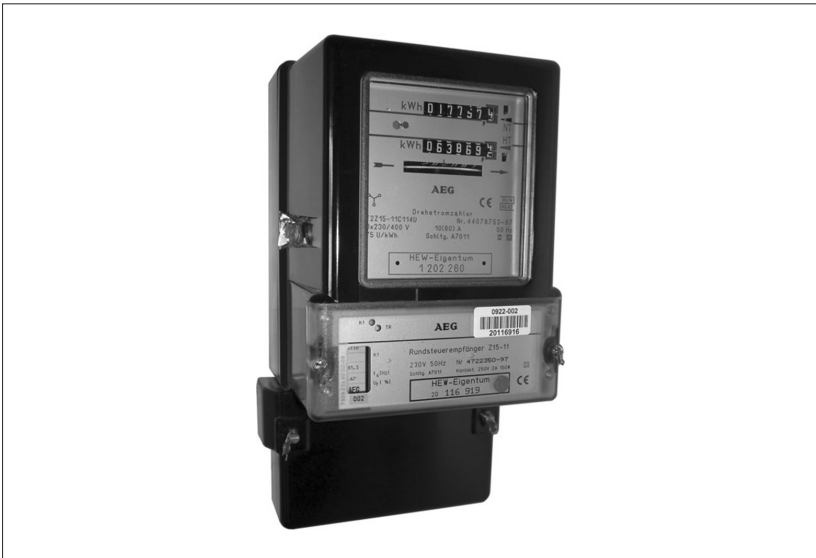
Abbildung 2: Zweitarifzähler mit Rundfunksteuerempfänger für Tag- und-Nacht-Tarif.

truhen, Nachtzeit bei Geschirrspülern und Wäschetrocknern) flexibel dazu, zudem können Elektrofahrzeuge mit hoher Batteriekapazität genau dann geladen werden, wenn die Nachfrage anderer Verbraucher sinkt, um eine stabile Nachfrage nach elektrischer Energie zu erzielen. Die Steuerung von „Stromfressern“ wie Nachtspeicherheizungen und Wärmepumpen durch ein intelligentes Stromnetz ergänzt das Konzept eines selbst-stabilisierenden Netzes (Smart Grid) über die Einbeziehung elektrischer Verbraucher.