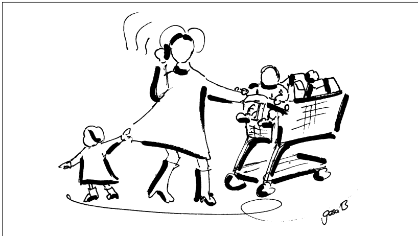
Abbildung 2: Komplexität des Alltags (eigene Darstellung)

Klimaberichterstattung und Aufklärungskampagnen können auch das Gegenteil des erwünschten Verhaltens auslösen, nämlich Gefühle der Überforderung und der Machtlosigkeit. In der Literatur ist die Rede von „Climate Fatigue“ und Umweltängsten (z. B. Kerr 2009). Soziologen und Haushaltswissenschaftler